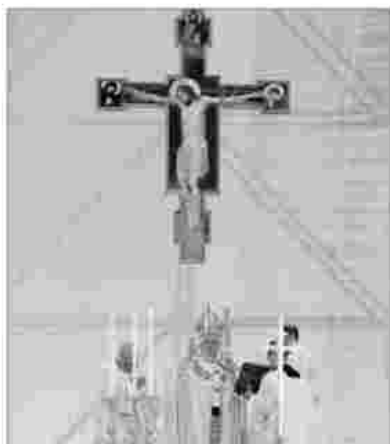
Sul prato la riproduzione del crocifisso di Talamato