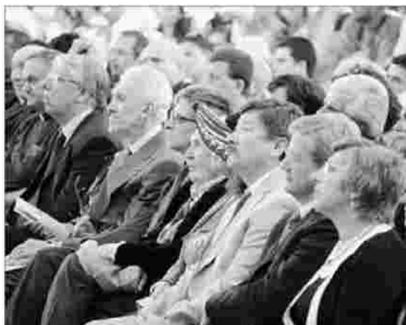
Anche per le autorità civili e militari è stata una giornata da ricordare