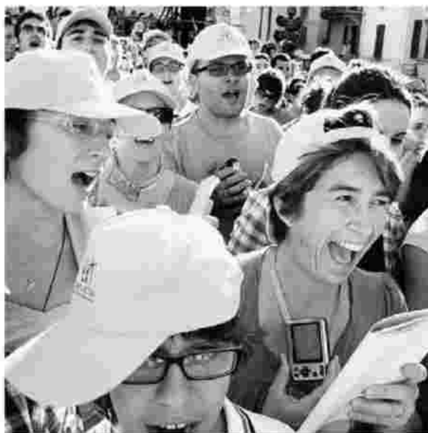
E per accogliere il Papa tutti assieme hanno scandito: "Benedetto uno di noi!"