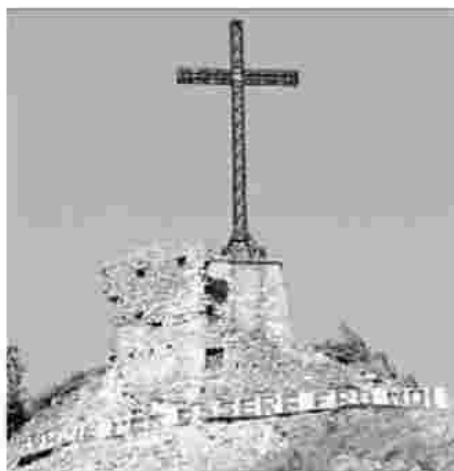
Anche la rupe è stata "addobbata" per l'occasione