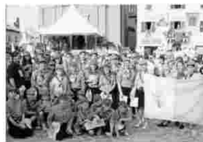
Tutti si sono organizzati: residenti e visitatori