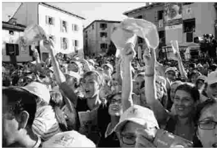
La piazza esulta quando viene annunciato l'arrivo in Papamobile del Santo Padre