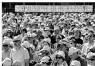
Sotto, in prima fila i rappresentanti del governo di San Marino