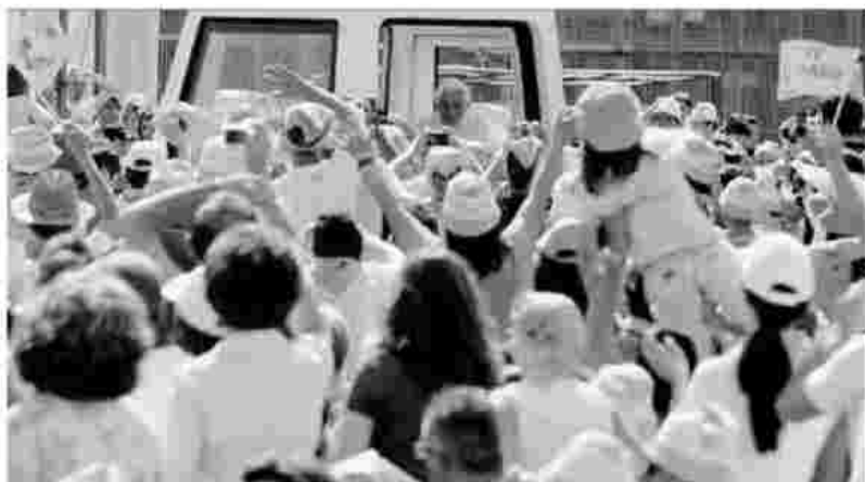
Nel prato tantissime famiglie con bambini, fedeli di ogni età