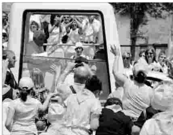
Il Papa è entrato allo stadio Olimpico alle 10, acclamato da 22mila persone